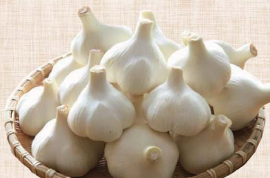
※写真は、イメージです。

シロップ (ブルーベリー・カシス) 378円 にんにくオイル、シロップ煮 540円